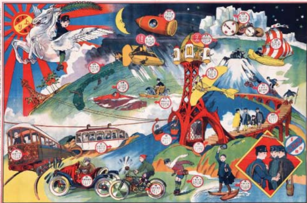
日本少年ふろく「少年未来旅行双六」(1934年)