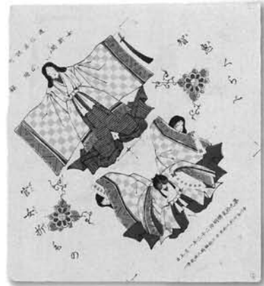
女新聞ふろく「智恵くらべ 官女折もの」(1890年)