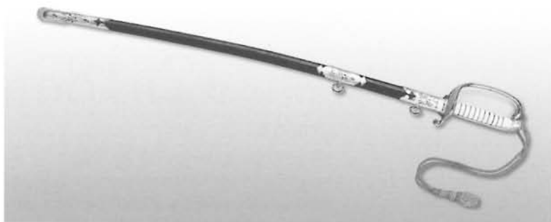
儀礼用のサーベル