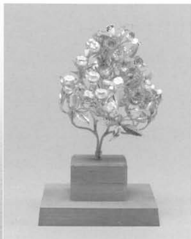
かざし 挿華 桜と橘(銀製)