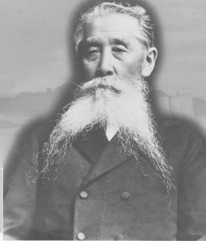
百円札の原版となった肖像写真