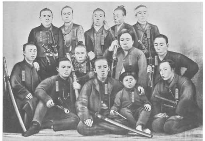
戊辰東征軍幹部写真から作製された石版画