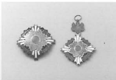
勲一等旭日桐花大綬章